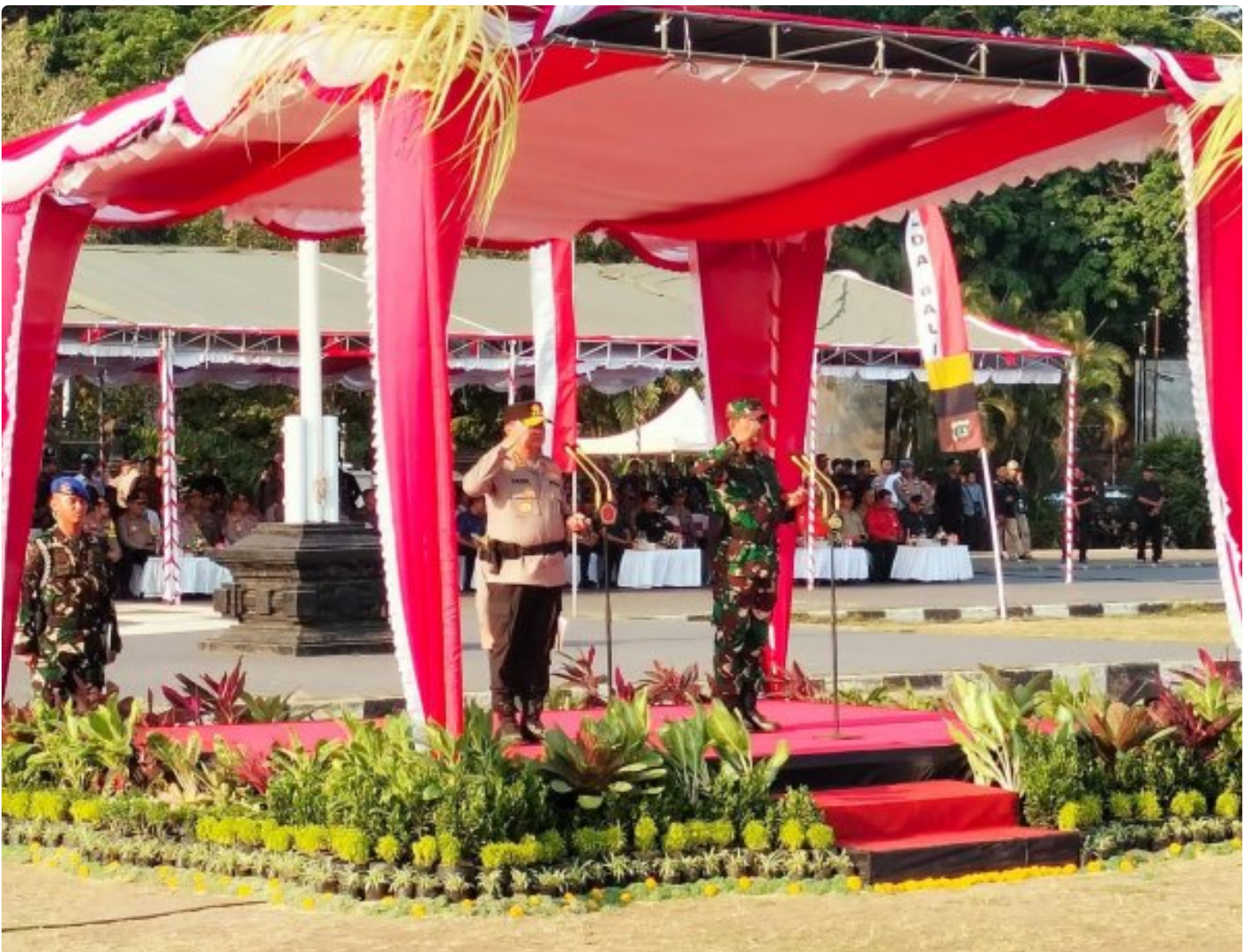
Sinergitas TNI-POLRI dan Masyarakat Bali

ALI - Polri bersama TNI telah menyiapkan pengamanan penyelenggaraan Konferensi Tingkat Tinggi (KTT) Archipelagic and Island State (AIS) Forum 2023 yang akan digelar di Bali pada 10-11 Oktober 2023.